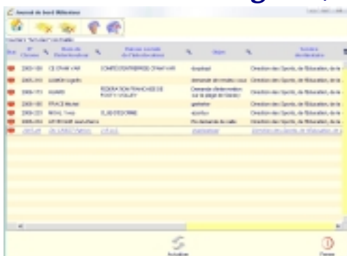
Journal de bord utilisateur personnalisé