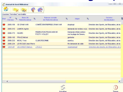
Journal de bord utilisateur personnalisé